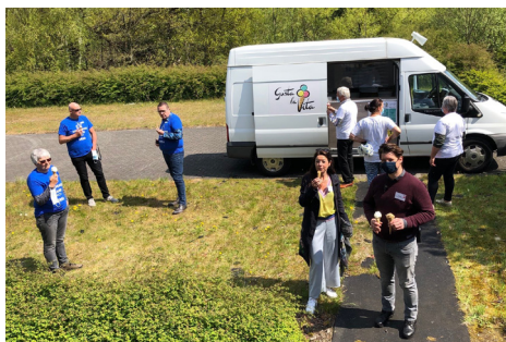
Ijsjes voor de vrijwilligers op 1 mei!